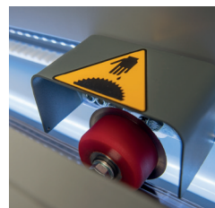
Lame circulaire auto-affûtante pour une fiabilité à long terme et aucun coût de service