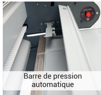
Barre de pression automatique