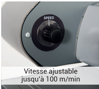
Vitesse ajustable jusqu'à 100 m/min