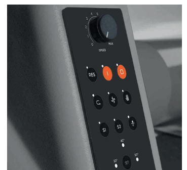
Régulateur de vitesse à réglage électronique