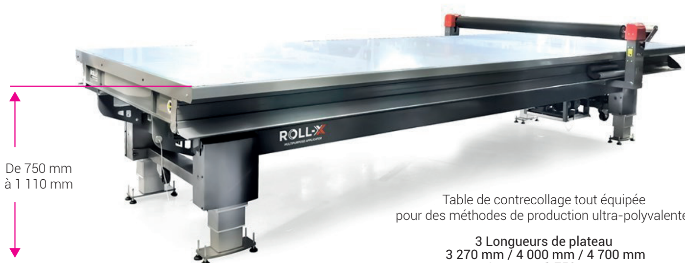
Table de contrecollage