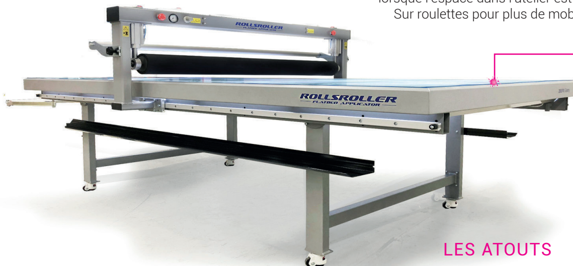
Table de contrecollage compacte idéale lorsque l'espace dans l'atelier est limité. Sur roulettes pour plus de mobilité