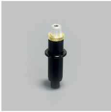
PORTE LAME SPA-0001