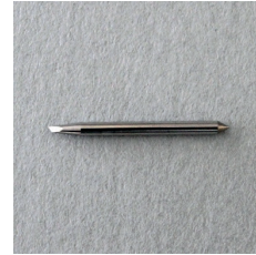
0,3 LAME PIVOTANTE POUR VINYLE SPB-0001 3 LAMES