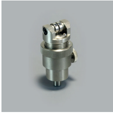
PORTE LAME 2N SPA-0113