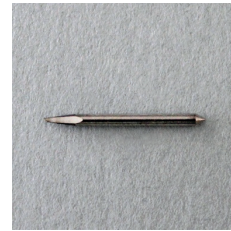
0,15 LAME PIVOTANTE PETITS LETTRAGES SPB-0003 3 LAMES