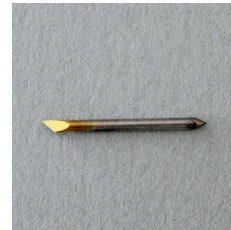
0,75 LAME PIVOTANTE SUPPORT RÉFLÉCHISSANT SPB-0006 2 LAMES