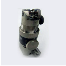
PORTE LAME JN SPA-0061