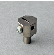
PORTE LAME 06 (S) SPA-0251