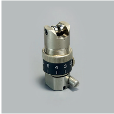
PORTE LAME RN SPA-0055