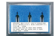
0,5 LAME PIVOTANTE SUPPORT FLUORESCENT SPB-0007 3 LAMES