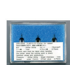
0,75 LAME PIVOTANTE POUR FEUILLE DE CAOUTCHOUC SPB-0005 3 LAMES