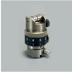
PORTE LAME 7N SPA-0054