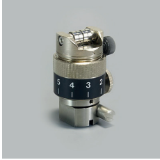
PORTE LAME 10N SPA-0077