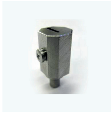
PORTE LAME 07 SPA-0114