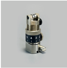
PORTE LAME 4N SPA-0053